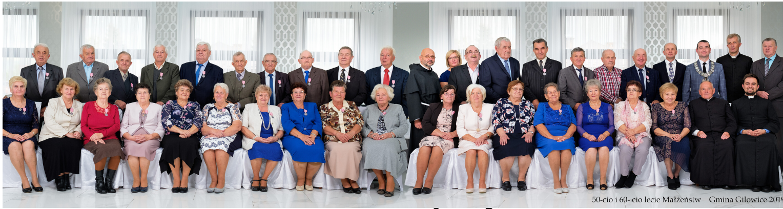
50-cio i 60-cio lecie Małżeństw Gmina Gilowice 2019